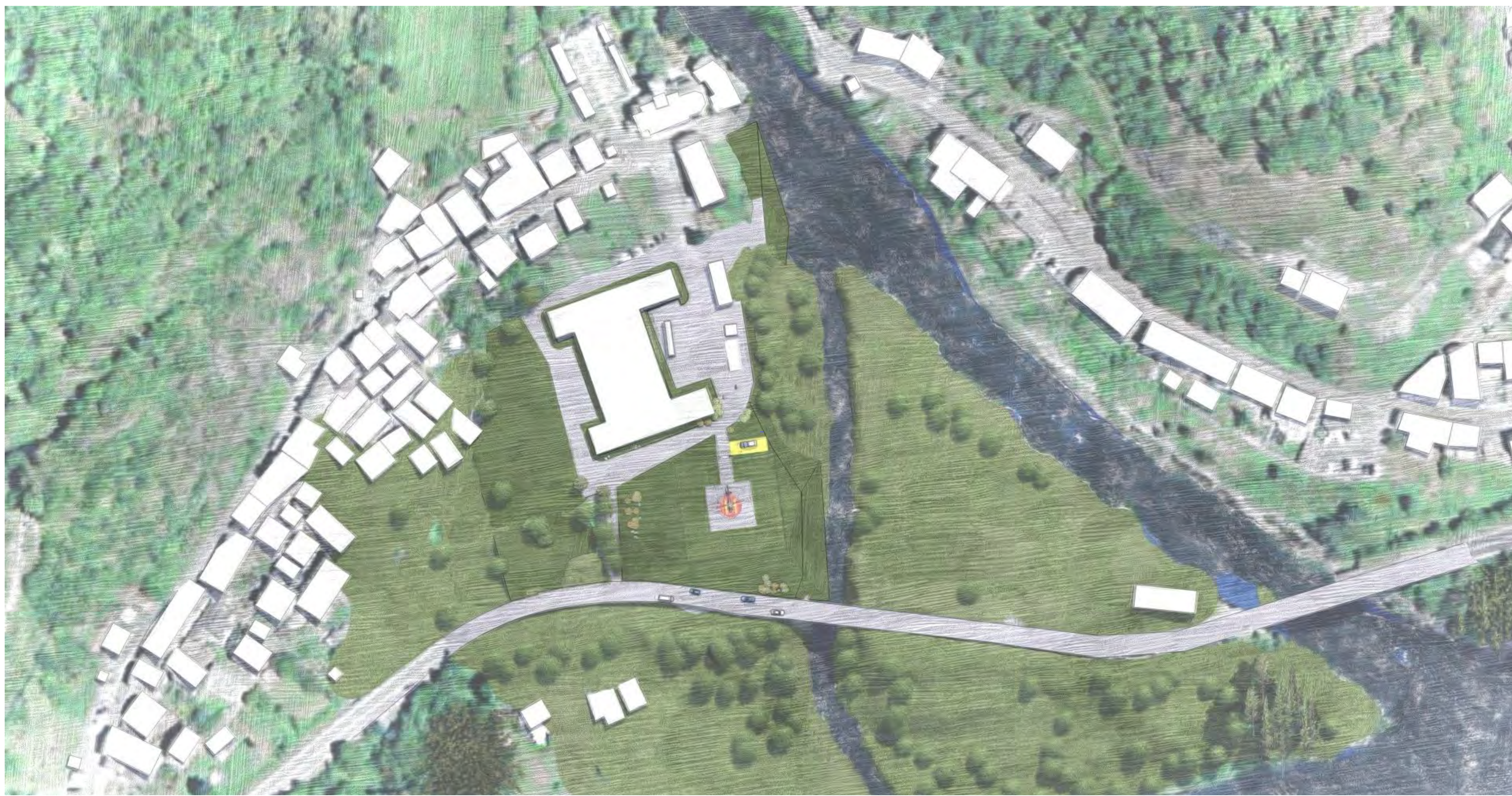
Planimetria generale - R 1:1000